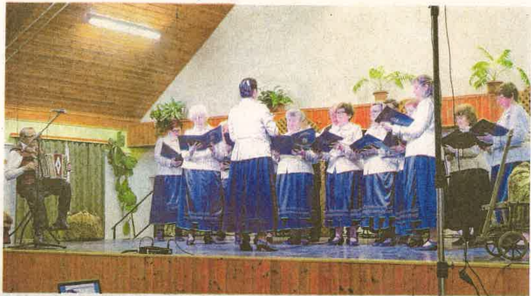
A megemlékezésen fellépett a márkói Steixner István Német Nemzetiségi Kórus