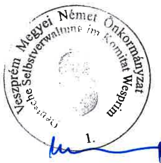
Heilig Ferenc Veszprém Megyei Német Önkormányzat Elnöke